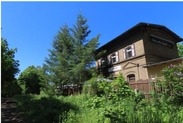
Abb. 4: Ehemaliges Bahnhofsgebäude