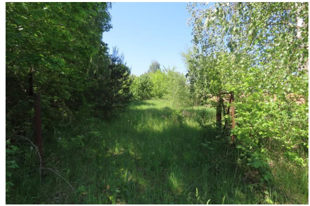
Abb. 7: Einfahrt zur südwestlich gelegenen Ruderalfläche