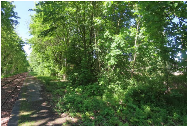
Abb. 6: Bahnsteig im mittleren und südlichen Bereich