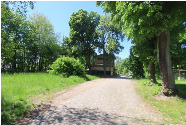
Abb. 2: Pflasterstraße von der Mühlenbecker Chaussee im Norden