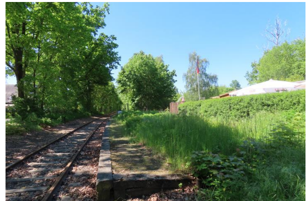
Abb. 5: Beginn des Bahnsteigs im Norden