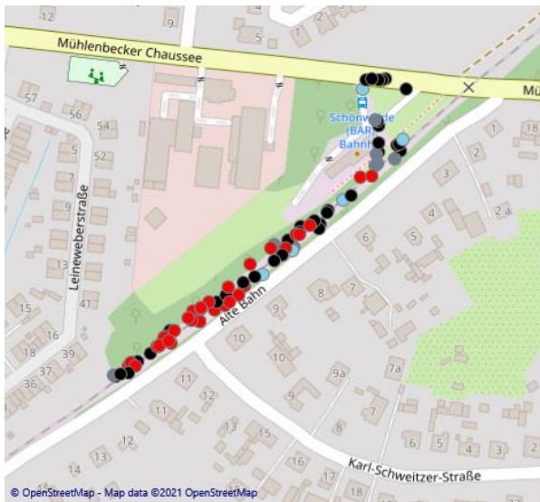
Abb. 10: Batloggeraufnahmen vom 20. Juni