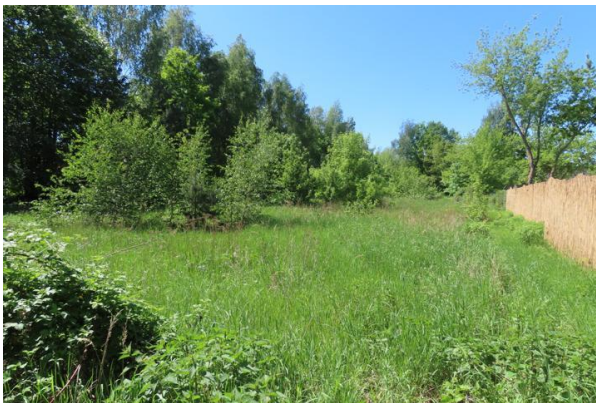
Abb. 8: Ruderalfläche im Südwesten