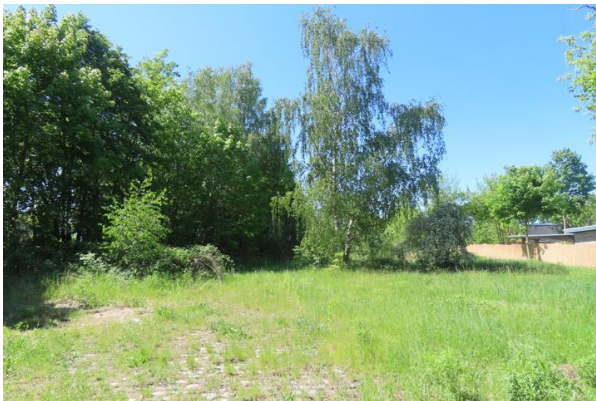
Abb. 13: Schütter bewachsener Bereich im Südwesten im April

Die späten Termine im Juli und August dienen vor allem der Feststellung von Fortpflanzungsnachweisen durch die Beobachtung gerade geschlüpfter Jungtiere. Nachsuchen nach dem Schlupf der Jungtiere erhöhen die Nachweiswahrscheinlichkeit, vor allem bei Flächen mit einer geringen Bestandsgröße, deutlich.