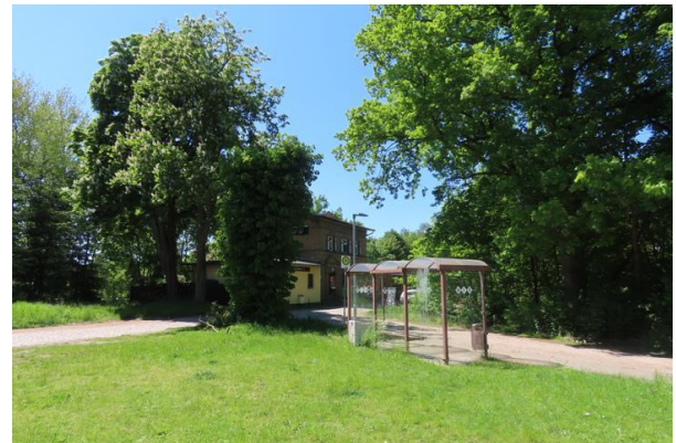
Abb. 3: Buswendeschleife im Norden