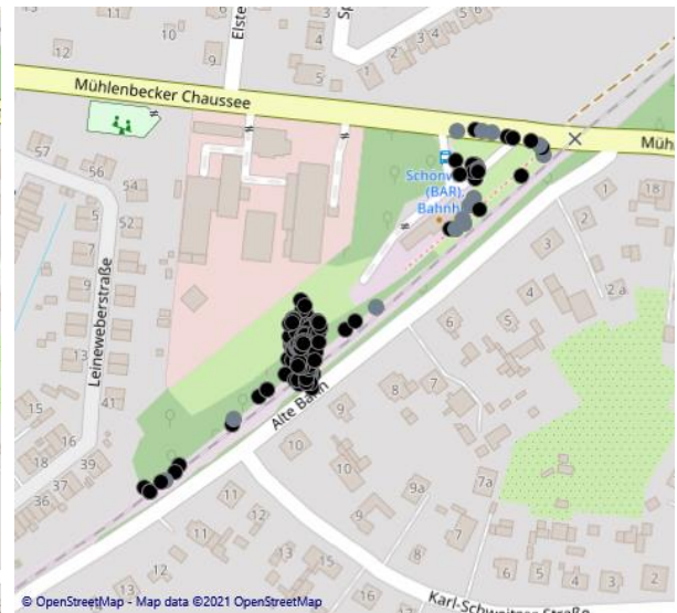
Abb. 11: Batloggeraufnahmen vom 05. Juli