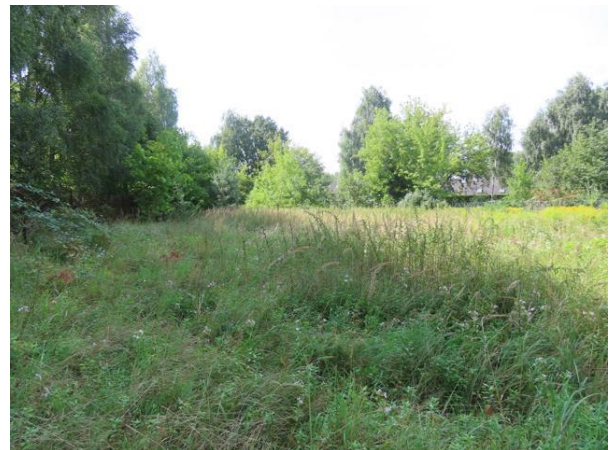
Abb. 14: Das gleiche Areal im Juli

Weiterhin wurde auf geeignete Lebensräume, Strukturen, Futterpflanzen, Spuren sowie Artnachweise geachtet, die ein Vorkommen weiterer europarechtlich streng geschützter Tierarten (Arten der Fauna-Flora-Habitat-Richtlinie) möglich erscheinen lassen (siehe Anhang).