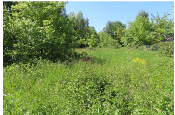
Abb. 9: Aufkommende Gehölze auf der Ruderalfläche