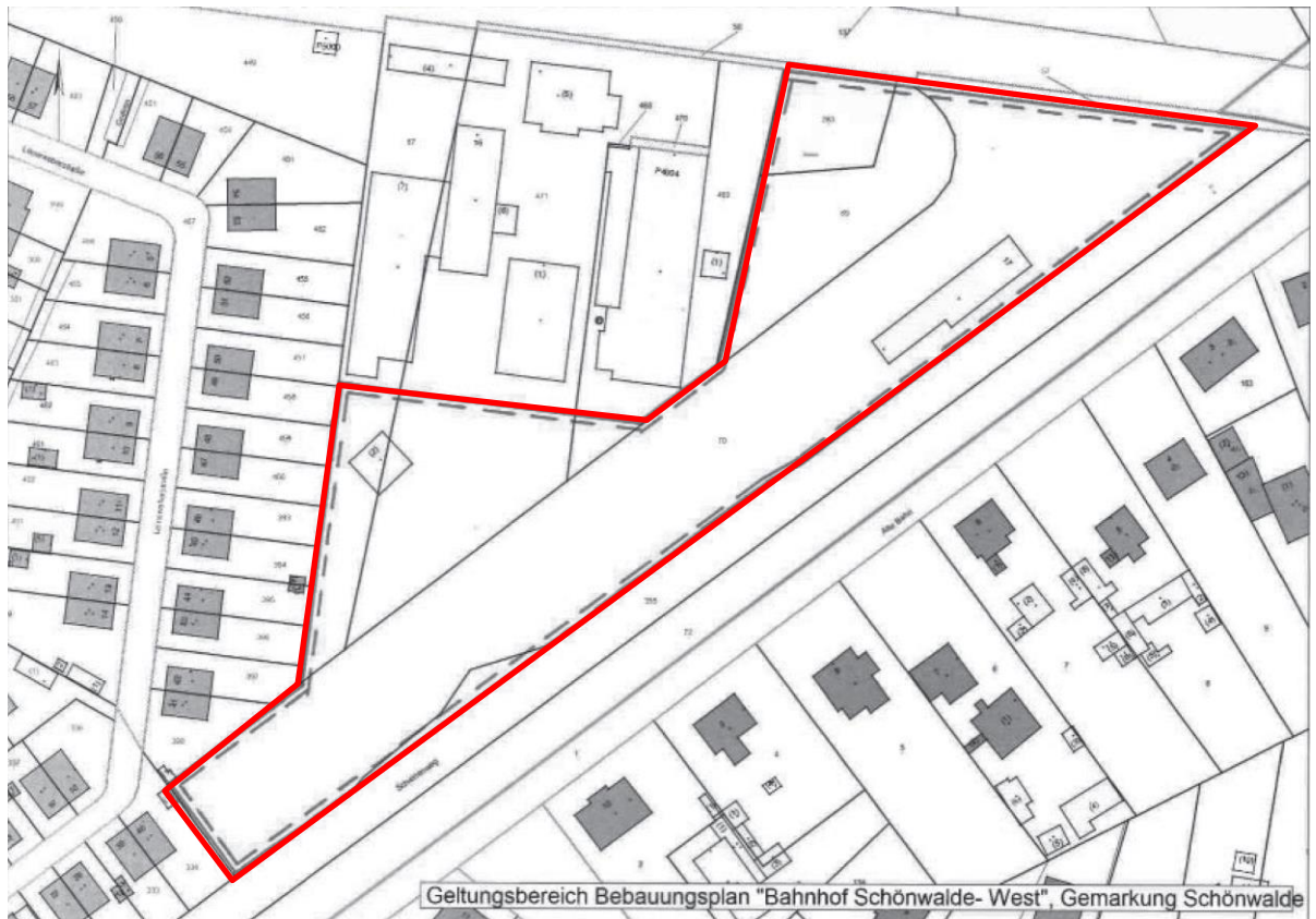
Abb. 1: Abgrenzung des Bebauungsplans „Bahnhof Schönwalde-West“