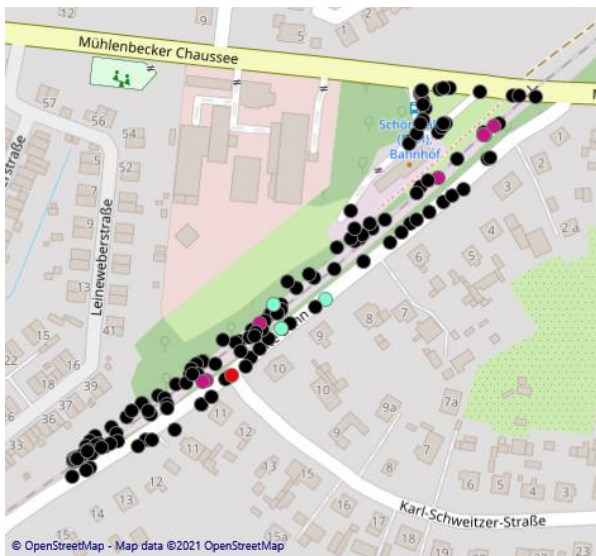
Abb. 12: Batloggeraufnahmen vom 22. Juli

Die quantitative Erfassung der Brutvögel erfolgte während sechs Begehungen im Zeitraum vom 01. April bis 02. Juni 2021 in Anlehnung an die von SÜDBECK et al. (2005) beschriebene Methode der Revierkartierung (siehe Tabelle 1). Dazu wurden alle revieranzeigenden Merkmale, wie singende Männchen, Revierkämpfe, Paarungsverhalten und Balz, Altvögel mit Nistmaterial, futtertragende Altvögel, bettelnde Jungvögel, Familienverbände mit eben flüggen Jungvögeln u. a. sowie Nester und Niststätten in Tageskarten eingetragen. Im April, vor der Belaubung der Gehölze, wurden diese nach vorhandenen Nestern von Krähenvögeln abgesucht.